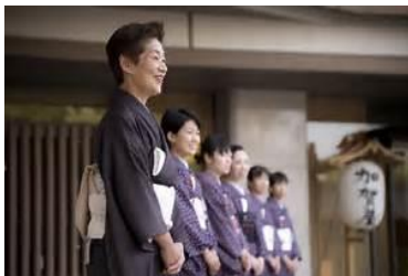
加賀屋旅館 お出迎えの様子

36年連続総合第1位の加賀屋の魅力やおもてなしをじかに体感し、加賀屋旅館がなぜこれほどお客様から支持されているのか、加賀屋の考える本当に良いサービスとはどういったものか、強み、加賀屋で働く方々の心得や顧客満足度を高めるための取り組みなどを交えてご教示いただきたいと思います。